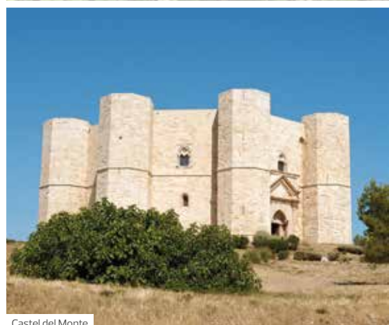
Castel del Monte